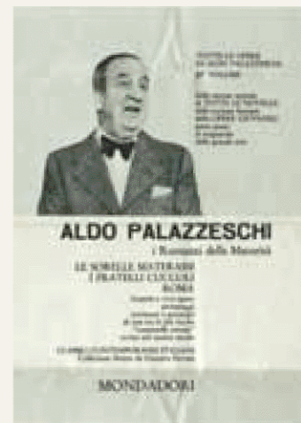
I Romanzi della Maturità . Pubblicità Mondadori per I romanzi della maturità . (FP)