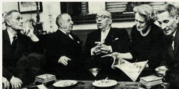
Con Arnoldo Mondadori insieme a Marino Moretti, Gianna Manzini e Dino Buzzati, 16 maggio 1958.