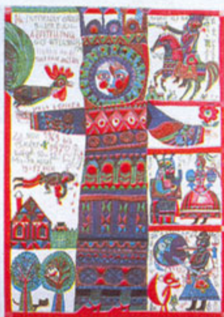
Bunte Kinderwelt 1969 im Klingspor-Museum.