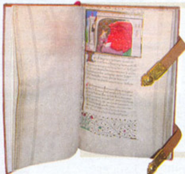
● Manoscritto esposto alla mostra su «L'enluminure en France au temps de Jean Fouquet» alla Bibliothèque du Musée Condé, Chantilly.

annullare la programmata mostra sul Marocco quando il regista olandese Theo van Gogh venne ucciso da un fondamentalista islamico di origine marocchina. La scelta fu di continuare.