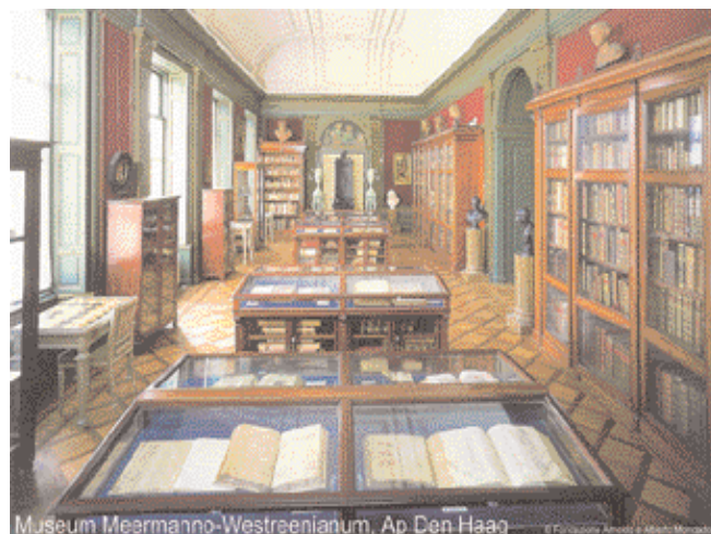
Museum Meermanno-Westreenianum, Ap Den Haag