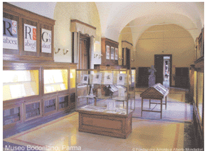
Museo Bodoniano, Parma