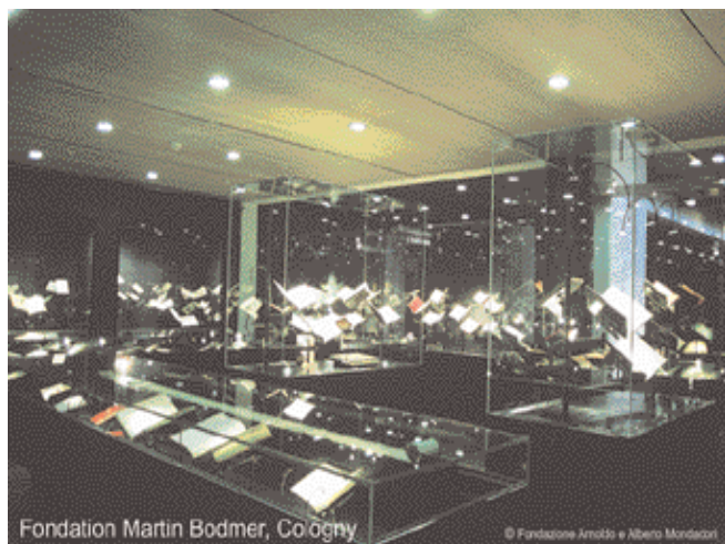
Fondation Martin Bodmer, Cologny

Si tratta però – ripetiamo, con l'eccezione del Museo bodoniano – di decidere quale attività pubblico-museale si possa assegnare ai luoghi del libro di antica e moderna tradizione: è indubbio che le nostre grandi biblioteche storiche, pubbliche o private, siano di fatto dei contenitori museali, ma ciò che possiedono non si vede: presentando il facsimile della Divina Commedia di Alfonso d'Aragona (edito da Panini), Umberto Eco di recente si è dichiarato soddisfatto di poter vedere almeno in questa veste un capolavoro altrimenti chiuso nei sotterranei della British Library; fuori dall'istruttiva battuta, è vero che una prima finalità educativa della biblioteca storica dovrebbe essere anche quella di predisporre percorsi di visita delle sue collezioni (dobbiamo dirlo? Costruendo «eventi» intorno al libro...) per epoche, generi, soggetti ecc. L'importante è rendere questa attività permanente perché solo così si conquista un pubblico, meglio, lo si forma.