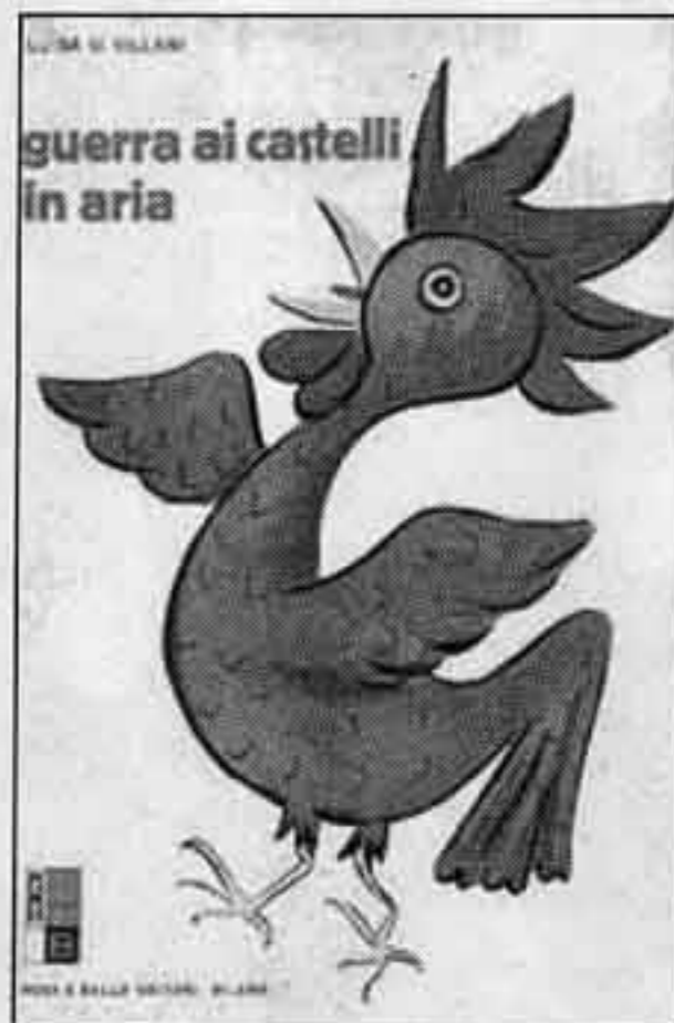
Qui sopra e a sinistra due copertine della casa editrice Rosa e Ballo, attiva a Milano fra il 1944 e il 1947

Il catalogo della mostra, piccolo e quadrato come sempre quelli della Fondazione Mondadori, raccoglie notizie utili e interessanti nei diversi brevi saggi che lo compongono, ciascuno dedicato a un aspetto della vicenda di Rosa e Ballo. E fornisce l'elenco completo delle opere pubblicate nei cinque anni di attività dell'editore.