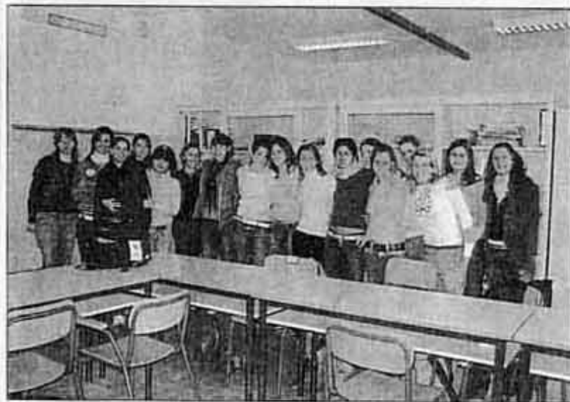
Le studentesse della classe quarta D, progetto Erika, che parteciperanno allo stage alla Triennale di Milano in occasione della mostra-laboratorio «Il mondo del libro»

La manifestazione sarà aperta, da martedì a venerdì, alle scuole per gli alunni dai 9 agli 11 anni. Le studentesse del «Viganò» insieme ad altri studenti universitari dovranno affiancare i visitatori e aiutarli nei diversi laboratori che si snodano attraverso un percorso che affronta le diverse fasi della vita di un libro.