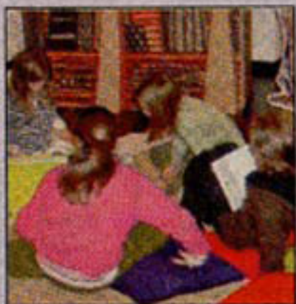
"Il mondo del libro"