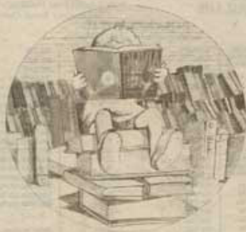
SCOPERTA I bambini e i libri

rati come i palazzi delle fiabe. Quesiti, percorsi, laboratori, costruzioni che aspettano i ragazzi che decidono di entrare. Ad animare gli spazi non sono però fate e maghi, ma semplicemente i personaggi che abitano il fantastico universo del libro. È con questo spirito che si presenta la mostra-laboratorio «Il mondo del libro», in programma alla Triennale di Milano da domani al 18 dicembre, aperta ai bambini dagli 8 agli 11 anni. La mostra accompagna i ragazzi in undici ambienti costruiti in cartone modulare dove incon-