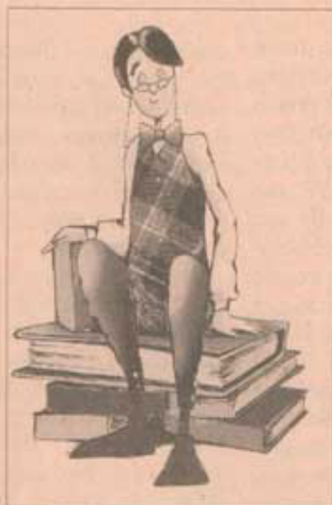
Due delle "guide" dei ragazzi alla mostra della Triennale di Milano: «L'illustratrice» e «Il restauratore»

«Il Mondo del libro», Milano, Triennale, via Alemagna 6, fino al 18 dicembre, 0239273061.