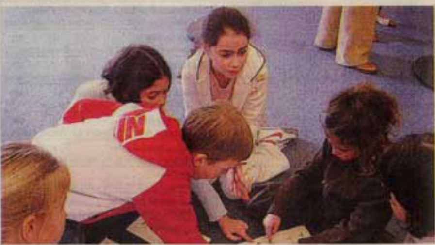
DA 8 A 11 ANNI Alla Triennale si gioca, si inventa, si «fa»: e il libro diventa un amico