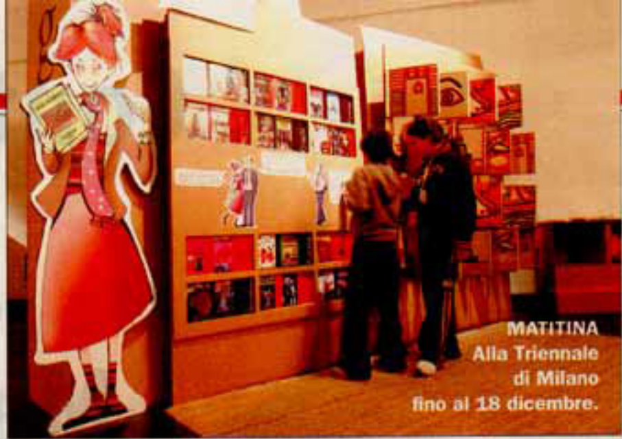
MATITINA Alla Triennale di Milano fino al 18 dicembre.

Considerato che durante le due ore della mostra nessun bambino chiede di andare in bagno, l'ottimismo è d'obbligo. (Carmelo Abbate)