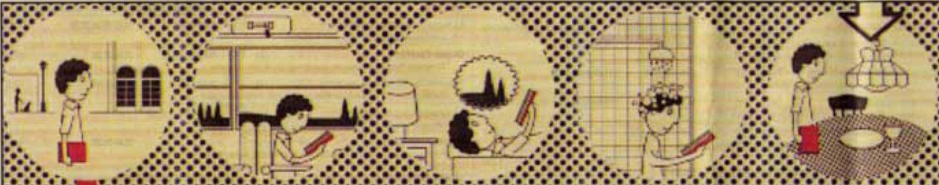
LEGGERE CHE PASSIONE Illustrazioni alla Triennale: come si vede, ogni posto è buono per sfogliare un libro. La mostra sarà aperta al pubblico da dopodomani